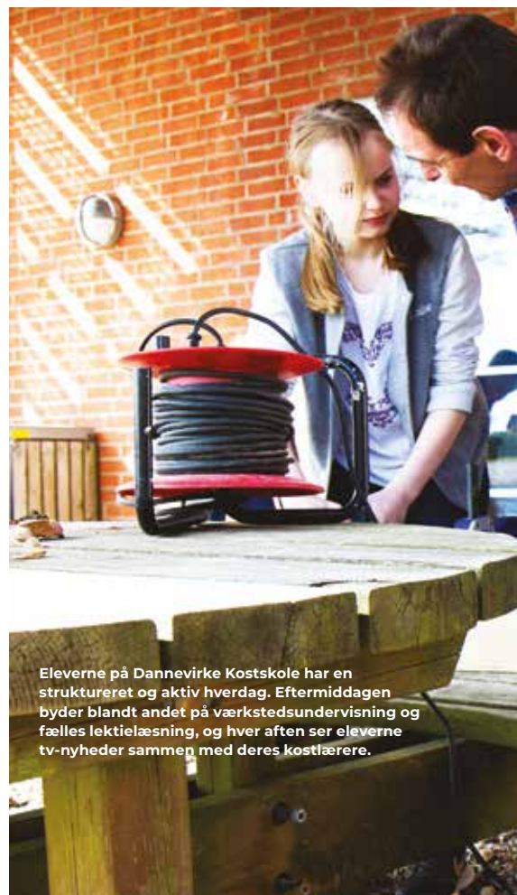
Eleverne på Dannevirke Kostskole har en struktureret og aktiv hverdag. Eftermiddagen byder blandt andet på værkstedsundervisning og fælles lektielæsning, og hver aften ser eleverne tv-nyheder sammen med deres kostlærere.